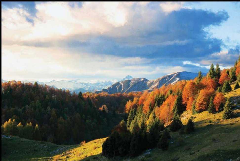
località Derocchetto - Erbezzo