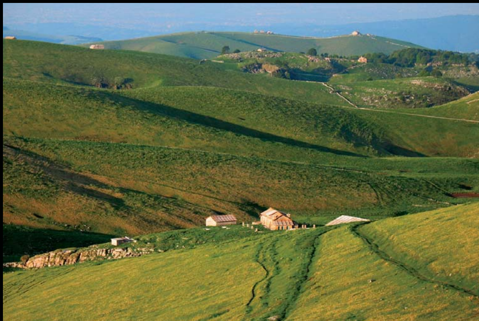
località Malera - Bosco Chiesa Nuova