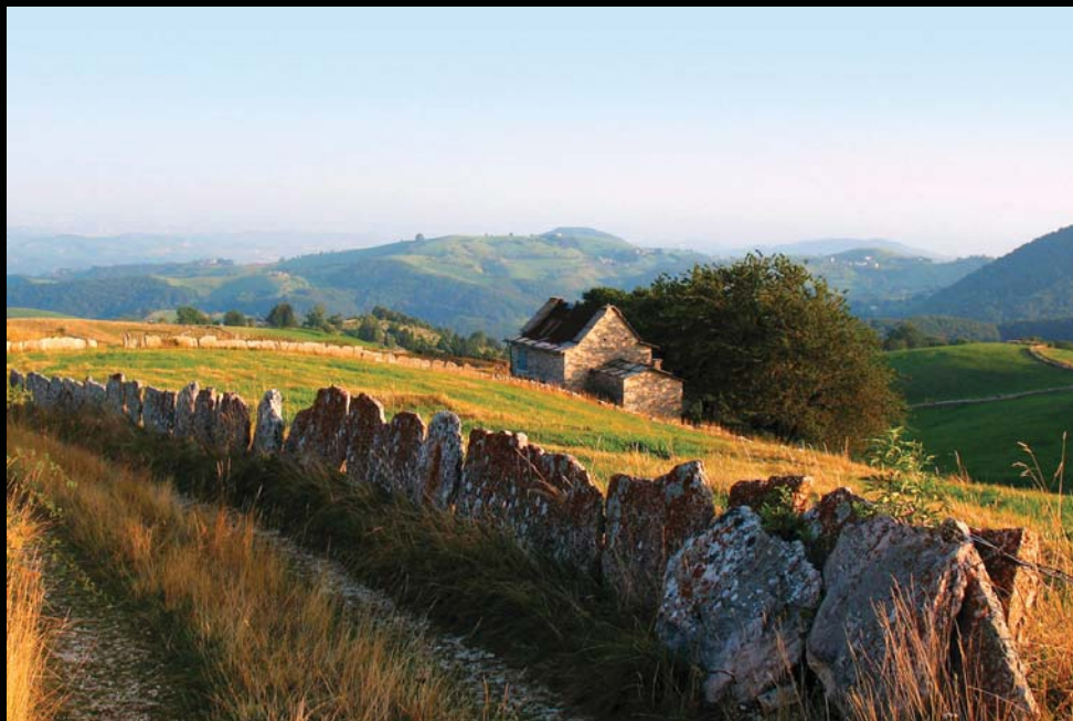
contrada Sengio Rosso - Roverè Veronese