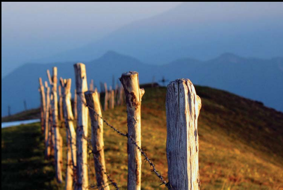
Cima Sparavleri - Bosco Chiesa Nuova