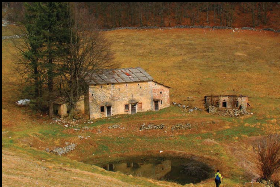
Malga Baston - Bosco Chiesa Nuova