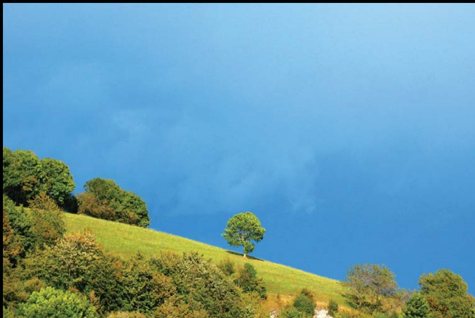
località Vazzo - Veto Veronese