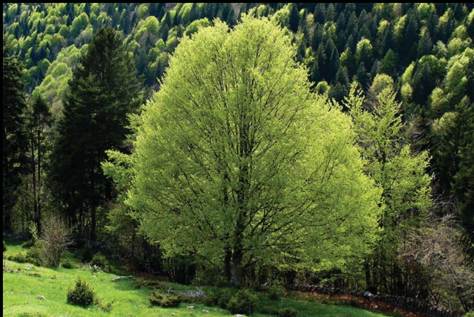
Valle dell'Anguilla - Erbezzo