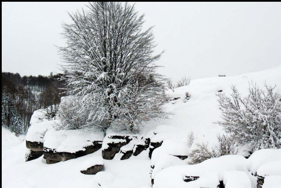
Conca del Paparì - Roverè Veronese