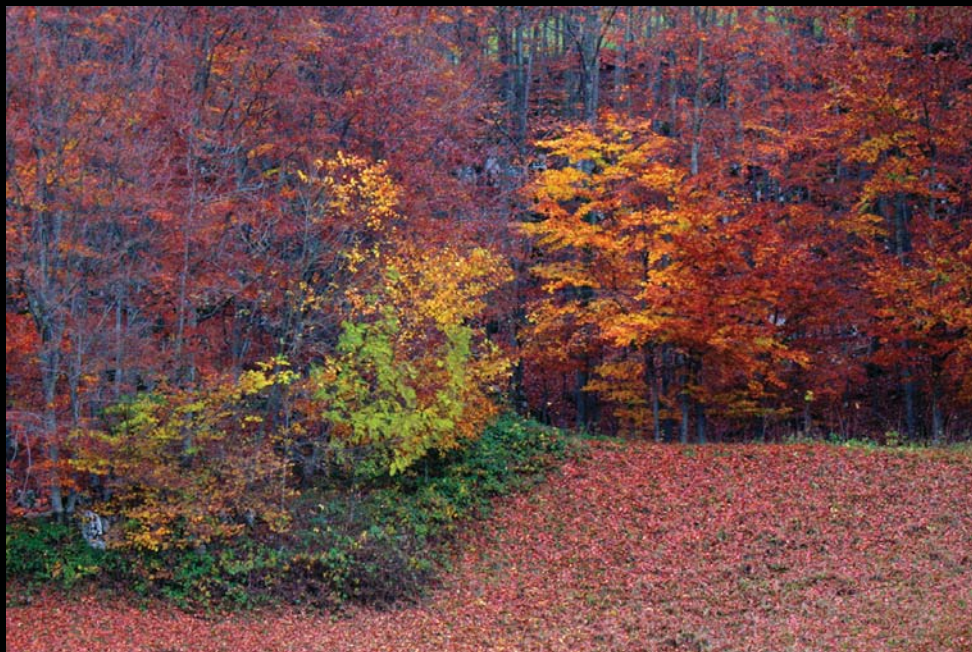
località Sartori - Roverà Veronese