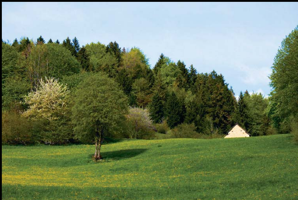
località Scandole - Erbezzo