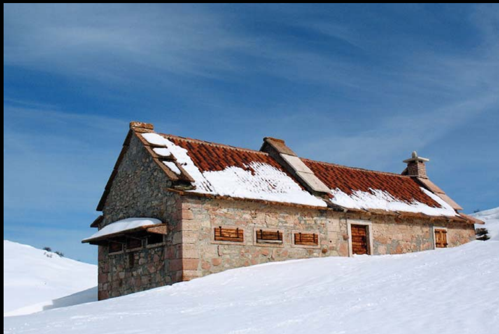
Malga Porto di Sopra - Selva di Progno